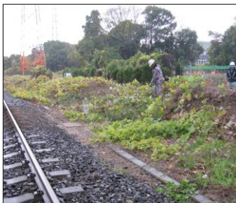
営業線に近接する除草作業