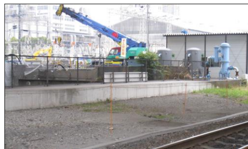
大規模な橋脚下部工事