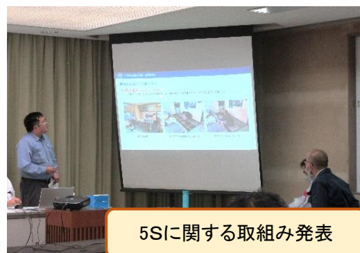
5Sに関する取組み発表

この委員会では、直近の事象対策に関するテーマを中心に、ヒヤリ・ハット情報に関すること、事業所での取組み発表なども行い議論を行っています。